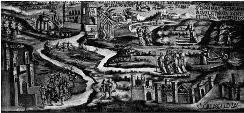
3. - Saint-Michel de la Cluse. Fresque de l'histoire de la fondation sur le mur de la « Madone de la Miséricorde ».

comtes de Barcelone 46 . L'apogée des conflits sanglants qui opposent ces «clans» a lieu en 978/9, lorsque le comte de Carcassonne Roger le Vieux défait et tue son adversaire le comte Raimond IV de Toulouse 47 . Pour expier le meurtre, comme Hugues tout à l'heure, Roger va en pèlerinage à Rome, accompagné de nombreux prélats septimaniens, partie prenante d'une affaire politique qui les concerne 48 . Il y a fort à parier que cette caravane «pèlerine» ait fait halte La Cluse et qu'elle ait occasionné des largesses en faveur du sanctuaire en passe de devenir abbaye.