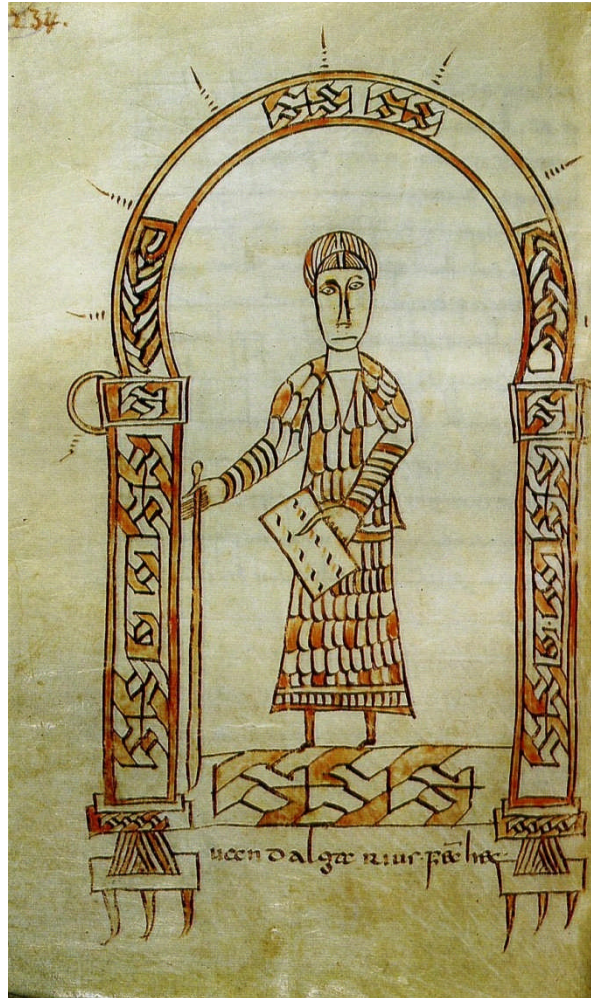
Législateur carolingien. Dessin extrait d'un manuscrit d'origine lyonnaise contenant la loi des Wisigoths, la loi salique, et la loi des Alamans (vers 793). Bibliothèque de Saint-Gall (Suisse), Ms. 731, f° 234.

grande abbaye alpine de Novalaise 11 . Plus que jamais le rôle des évêques est ainsi déterminant dans tous les domaines, aussi bien administratifs qu'ecclésiastiques. Le pape Grégoire I er le Grand (590-604) demande à l'évêque Aetherius de lui faire parvenir les œuvres de saint Irénée, célèbre martyr lyonnais. Ce même Aetherius est vraisemblablement l'auteur — tout au moins le commanditaire — de la première collection canonique gauloise de type systématique, la Vetus Galica (v. 600) 12 .